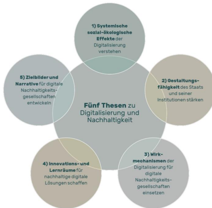
Abbildung 1: Fünf Thesen für die Verschränkung von Digitalisierung und Nachhaltigkeit (eigene Darstellung).